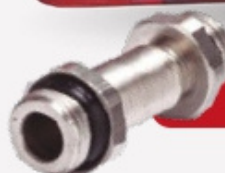
SELLO ELASTOMÉRICO PARA FLEXIBLES AGUA